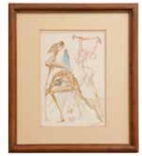
75 ***** SALVADOR DALÍ (FIGUERAS, ESPAÑA, 1904 - 1989)

Divina Comedia. Litografía. EA/100. 26 x 18 cm.