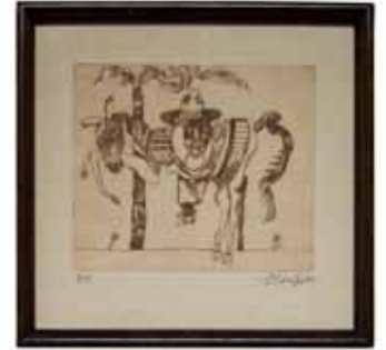
78 *** GERARDO CANTÚ (COAHUILA, 1934 - )

Grabado 3/15. Firmado y fechado 89. Hoja: 33 x 28 cm. Grabado: 19 x 22 cm.