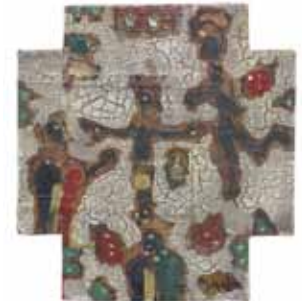
81 *** FÉLIX ZAPATA (MONTERREY, N.L.)

Cruz con Milagros. Mixta/ madera. Firmada. 26 x 24 x 4 cm.