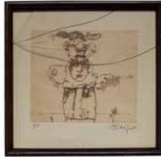
77 *** GERARDO CANTÚ (COAHUILA, 1934 - )

Grabado, 14/15. Firmado y fechado 89. Hoja: 33 x 28 cm. Grabado: 20 x 22 cm.