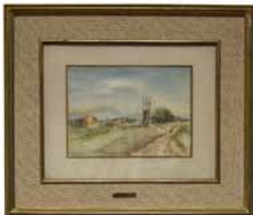
79 *** GRAL. IGNACIO BETETA (HERMOSILLO, SONORA, 1898 - CDMX, 1988)

Acuarela. Con placa informativa. 20 x 27 cm.