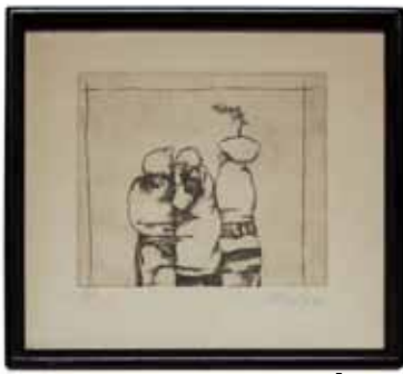
73 *** GERARDO CANTÚ (COAHUILA, 1934 - )

Grabado 3/137. Firmado y fechado 89. Hoja: 33 x 26 cm. Grabado: 10 x 14 cm.