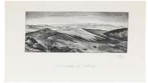
21 GERARDO MURILLO DR. ATL (GDL. , 1875 - CDMX, 1964)

43 x 28 cm $ 15,000.00 - $ 25,000.00 MXN