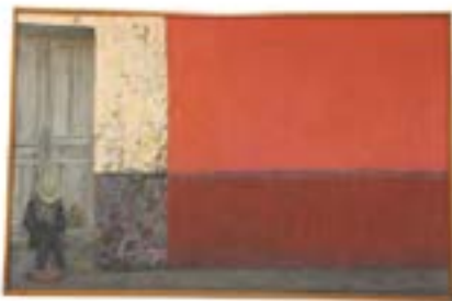
67 CLAUDIO FERNÁNDEZ (MTY, N.L 1925 - ) Óleo/tela Firmado y fechado 83 Enmarcado 70 x 120 cm $ 8,000.00 - $ 10,000.00 MXN