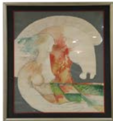
68 ALBERTO CAVAZOS Acuarela Firmado y fechado 1987 Enmarcado 104 x 77 cm $ 6,000.00 - $ 9,000.00 MXN