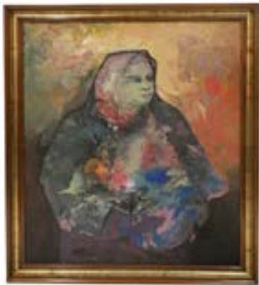
22 ESTEBAN RAMOS

43 x 28 cm $ 15,000.00 - $ 25,000.00 MXN