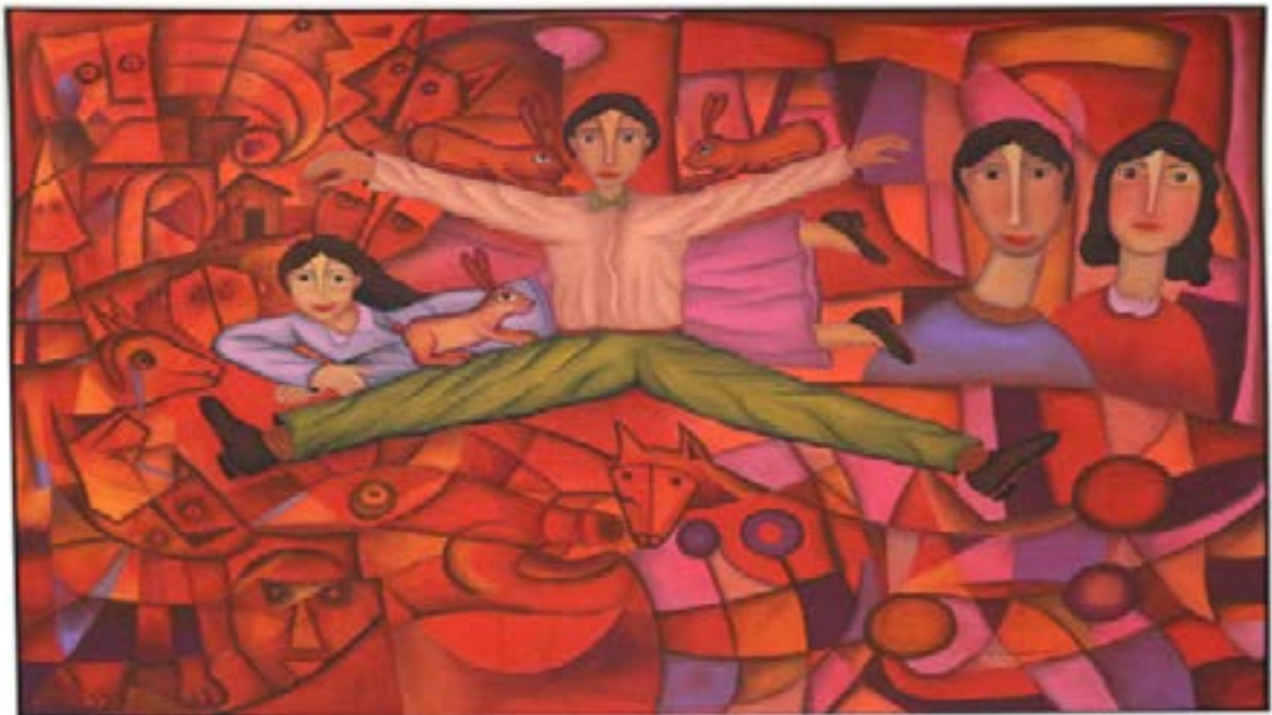
83 ROMÁN ANDRADE LLAGUNO (OAXACA 1959 - ) "La Tarde Del Mago" Mixta/tela Firmada y fechada 2015 Enmarcado $ 50,000.00 - $ 80,000.00 MXN