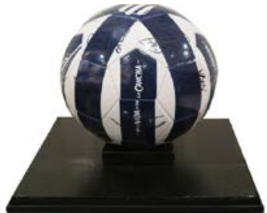
73 BALÓN DE RAYADOS AUTOGRAFIADO Balón de Rayados Autografiado, montado sobre madera con cubierta de acrílico.