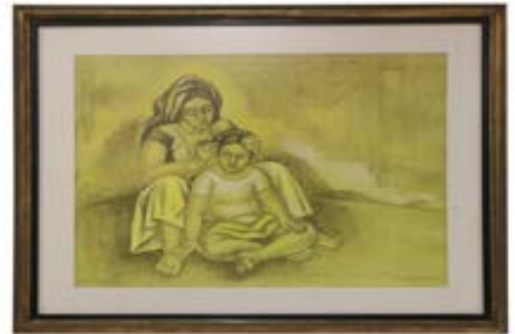
66 RAÚL ANGUIANO (GUADALAJARA 1915, CDMX 2006) Litografía 89/100 Firmada y fechada 83 Enmarcada 54 x 72 cm $ 3,400.00 - $ 4,500.00 MXN

60 x 90 cm $ 14,000.00 - $ 20,000.00 MXN