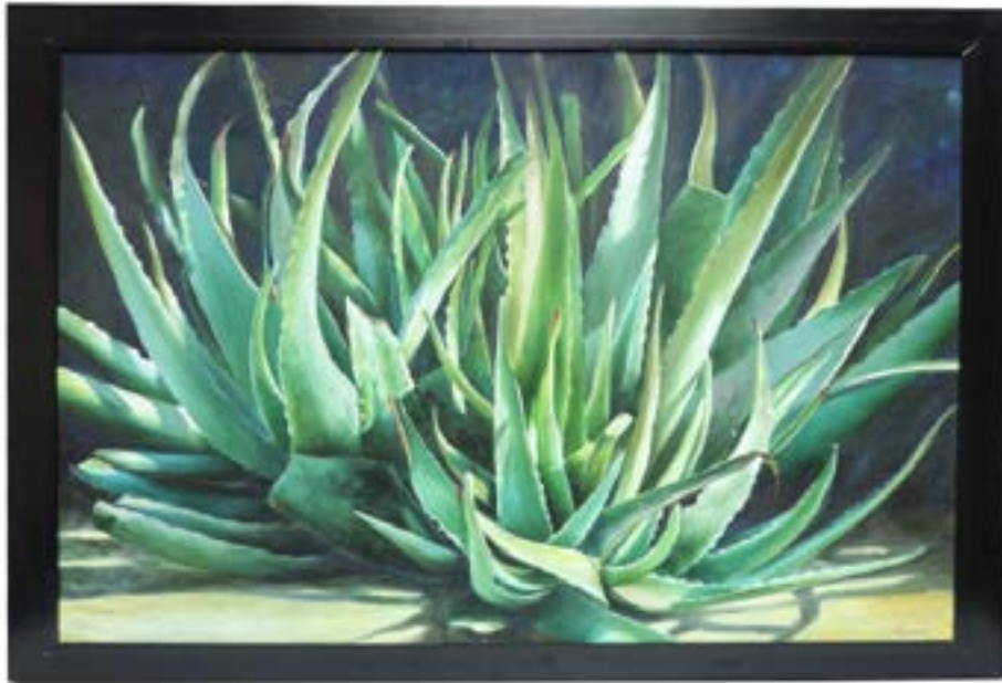
82 ANTONIO ZORÍN Magüey Óleo/tela Firmado y enmarcado $ 45,000.00 - $ 60,000.00 MXN