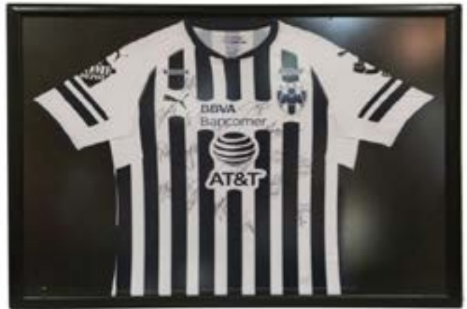
71 CAMISA RAYADOS AUTOGRAFIADA Camisa Rayados Autografiada, enmarcada.