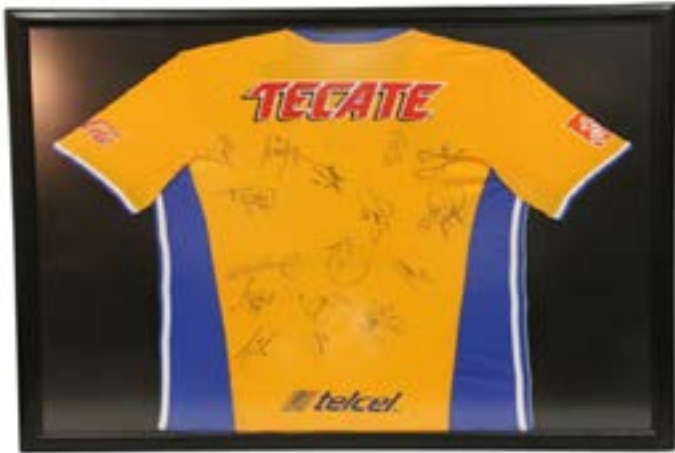
70 CAMISA TIGRES AUTOGRAFIADA Camisa Tigres Autografiada, enmarcada.