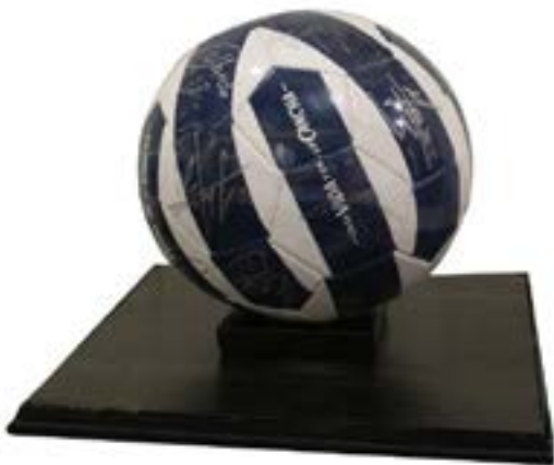
72 BALÓN DE RAYADOS AUTOGRAFIADO Balón de Rayados Autografiado, montado sobre madera con cubierta de acrílico.