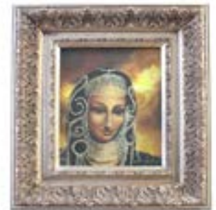
69 GABRIELA GARZA PADILLA (MTY, 1965 - ) "HIJA DEL SOL" Óleo/tela Firmado y enmarcado. Con inscripción al reverso. 25.5 x 20 cm $ 6,000.00 - $ 9,000.00 MXN