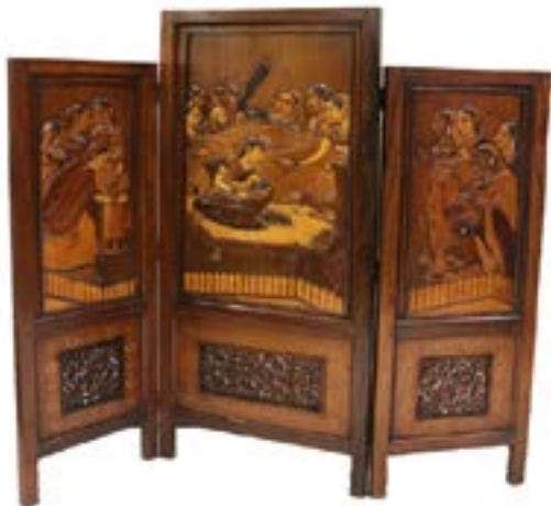
63 BIOMBO HINDÚ

Realizado en madera de 3 hojas. Escena principal de una mujer hindú amamantando, acompañada de damas en alto relieve. Diseño con pequeñas incrustaciones de hueso, marquetería geométrica y talla de motivos vegetales.