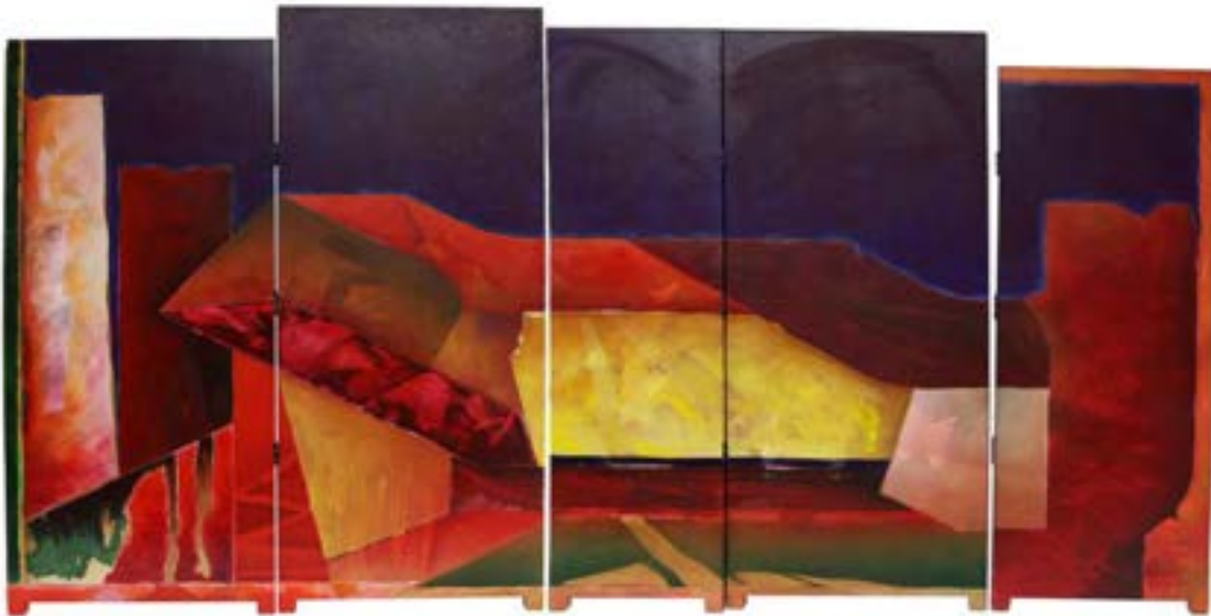
62 IGNACIO SALAZAR (CIUDAD DE MÉXICO 1947 - )

"Xachitlan", 1987 Biombo en 5 hojas Mixta/tela y panel Exhibido en el Museo de Monterrey en la exposición "Retrospectiva de Ignacio Salazar".